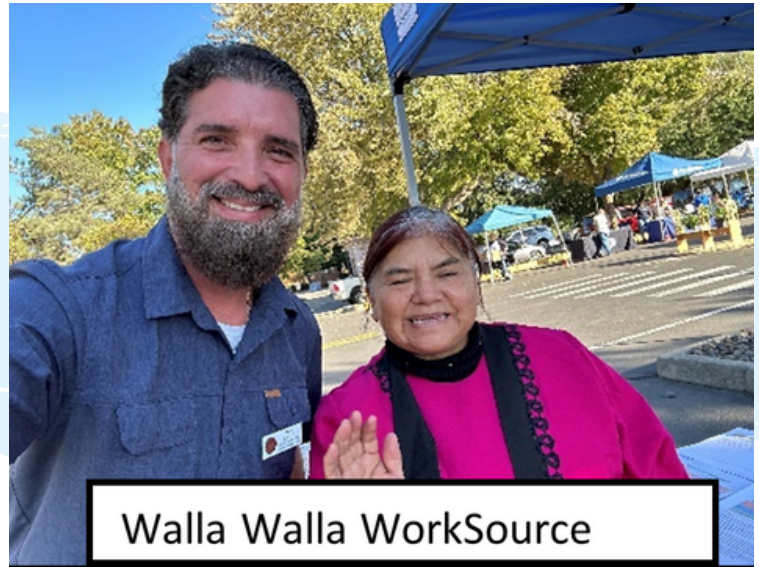
Walla Walla WorkSource