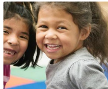
Elementary School Academics (K-6)

Desplácese hacia abajo y haga clic en el icono Académicos de la escuela primaria (K-6)