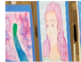
Family Life Education (FLE)

The Family Life Education program follows state guidelines for grades K-6.