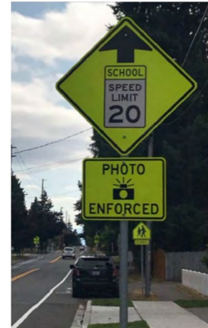
Ejemplo de una señal de advertencia de cámara de velocidad en una zona escolar en Kirkland, Washington.

Haga clic aquí para conocer más sobre cómo lucirían estas cámaras en Arlington. Haga clic aquí para ver la página del proyecto y tener acceso al volante en otros idiomas.